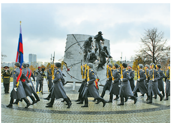
Аллею Спецназа заложили в петербургском парке Интернационалистов в День подразделений специального назначения России. Она появится рядом с памятником «Бойцам спецназа России — защитникам Отечества», открытым 24 октября 2012 года. Идея создания памятника принадлежит действующим сотрудникам и ветеранам различных спецподразделений России.