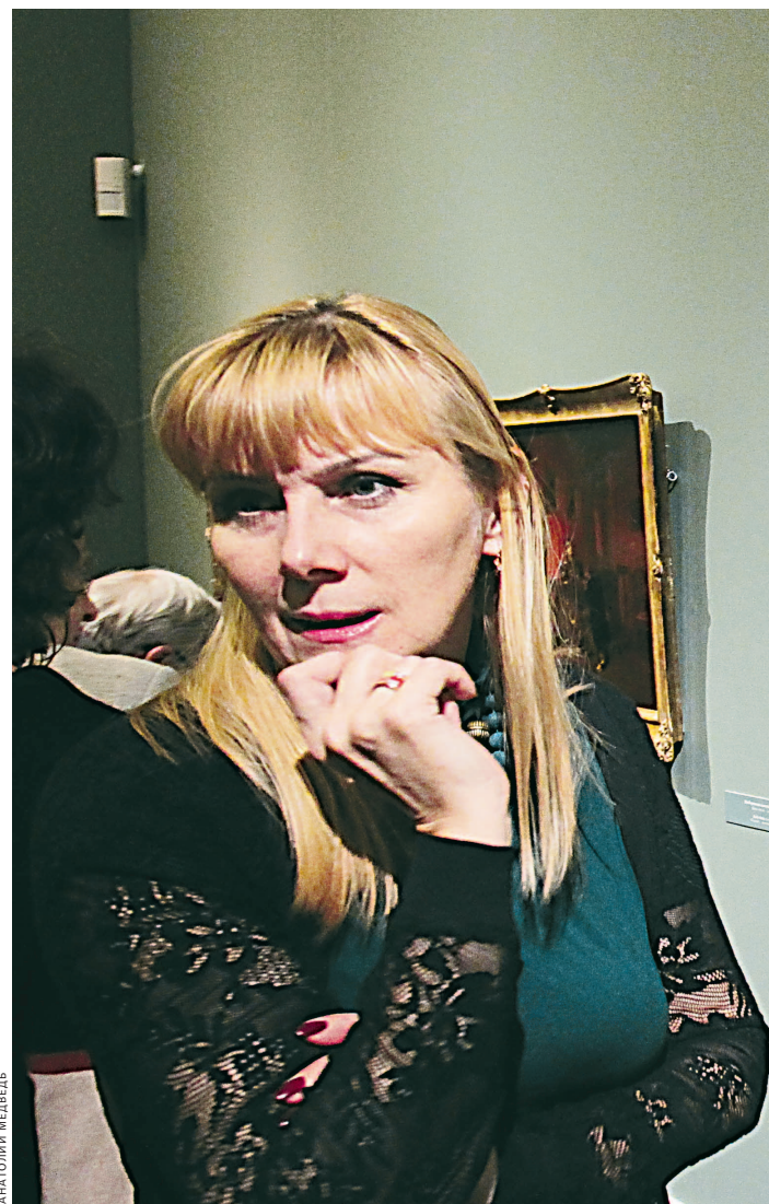
В Русском музее открылась выставка произведений Павла Федотова, приуроченная к 200-летию со дня рождения мастера. В экспозиции собраны 40 живописных и 100 графических работ, которые позволяют сформировать полное представление о творчестве художника.